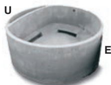
An. terminale sedim.